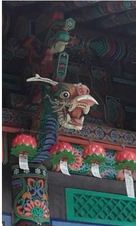
Drake på tempel.

Men, det verkar som att denna, snart 10.000 åriga gynocentriska civilisationen inte bara har förstått principerna eller livskoderna, utan som att de också kunnat använda kunskapen på olika sätt. De byggde byar och en centralort utifrån de universella principerna vad detta innebar kan jag mer ana än förstå... I Budoji och i den koreanske folktraditionen finns berättelser, som är mycket lika våra egna folkberättelser om de Gamla Kärringarna, som kunde binda in stormarna i knutor eller släppa loss dem; om Fru Holle som skakar kuddar så fjädrarna yr – och snön faller i byarna; om Kärringen och Hel (koreansk Hal-mi/ma, Hel Mor) som kastar med enorma stenblock osv. Från Nordens arkeologi vet vi att man keramisk kunde glasera hela borgar i fri luft (keramisk bränning kräver annars 1200gr C, emedan en storbrand (i fri luft) bara i bästa fall når upp på 600gr C). Det är mycket de kunde göra i bronsåldern som vi inte vet hur de gjorde än idag.