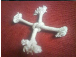
De gamla Kärringarna som kunde ett och annat...

Under 1000 år, säger Budoji , byggdes otaliga borgar (Mago-strongholds) på alla de högsta bergen i hela Ost-Asien – i princip hade varje by eller område en egen borg. De finns idag och Korea är ”borg-tät.” Här rådde de gamla vis-mödrarna och shamanerna, Goma, Eomma, Ma Gaia och Lin-mön (Fröja). Vi anar deras namn i våra ord, Gumma, Omma, Gaja och Fröja. De kände till solens, månens och stjärnhimlens vandringar. Stora Björnens stjärnbild och Polstjärnan var centrala i deras världsföreställning, och symbolen ”Livsträdet”, Sindansu , var det kosmiska världsträdet som förband de nio världarna. Vi känner också igen både Världsträdet med tre rötter som förbindar de nio världarna (Eddornas Yggdrasil som nog hette