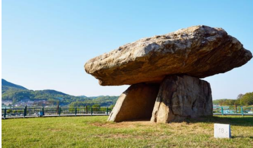
Koreansk Dolmen.

Koreanerna älskar valar och idag gråter hjärtan som våra, för allt plast i havet som valarna sväljer och dör av. Olika grupper arbetar för att hålla åtminstone de salta förlösningsfickorna i havet plastfria.