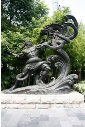
Contemporary sculpture of Yu the hero fighting the nine-headed snake.