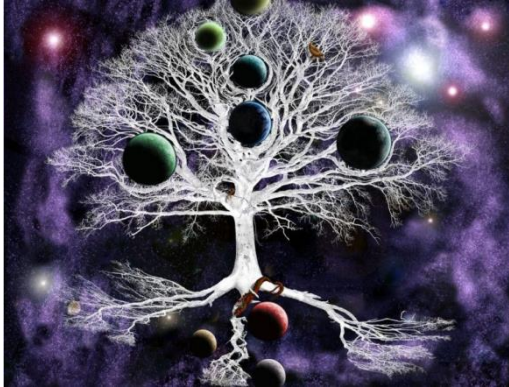
Livsträdet med nio världar

något annat innan det omgjordes av asa-religionen till Ygg/Odens drasil/häst). Polstjärnan och St. Björnens stjärnbild är även de, viktiga i vår egen gamla världsföreställning i Norden.