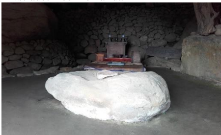
Urgammal sten m skålgropar som Karlavagnen