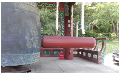
Tempelklocka med val.

Valens djupa sång kan höras över långa, långa avstånd i havet, upp emot 100km - och valens vänner, människan kommunicerade en gång som valarna, kanske med? dem, med hjälp av de tunga tempelklockorna som förseddes med ljudpipor uppe på toppen och djupa gropar i golvet nedanför som åstadkommer den djupa resonansen. Trädstocken som slår på klockan kallas ännu valen .