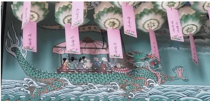
Utflykt på drakens rygg.