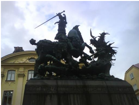
Stockholms St Görän o Draken.