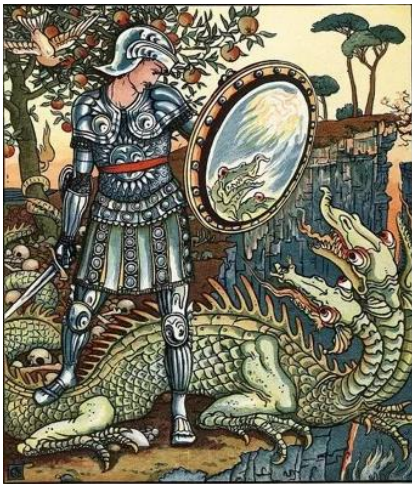
Hjälte dödar trehövdad drake.

Således härstammar alla berättelser med triader och nio-tal, drakar osv. ursprungligen från den Ost-Asiatiska Mago -civilisationen, urmödrarnas universitet i Gorya/Korea, valens land (dvs. Öst-Asien, och inte i strikt mening Korea). Magos vetenskapliga symbolik, som var känd i det äldste Kina, kom (i förvrängd form) att utgöra fundamentet för all senare kinesisk patriarkal religion och filosofi. Till dessa hör Daoismen, Konfucianismen och Buddhismen – och alla patriarkala religioner. Senare spred de patriarkala religiösa läror till västen, till judendomen, kristendomen och islam. De gamla symboler och siffror blev religiösa i stället för heliga universella och vetenskapliga principer för det LIVGIVANDE FEMININA. – Och